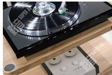
搭配的E.A.T.的唱盘以及MC Jo N° 5唱头