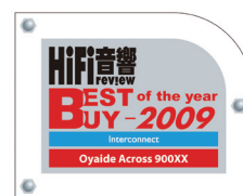
榮獲「Hi Fi音響」頒贈 2009年度最超值訊號線獎項