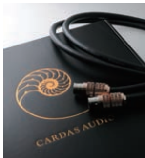
Cardas Audio Clear Reflection 規格：● 導體：2 x 25.5AWG 純銅 ● 絕緣：PFA / 空氣 ● 長度：1.5 米 ● 定價：HK$16,200/ 每對

去年尾，Cardas 創辦人 George Cardas 親臨香江介紹新作 Clear Reflection，在場的媒體朋友及小弟都很期待新產品真正上市的一天，因為 George 在發佈會上已聲明，Clear Reflection 的排位僅次於 Clear，品質高於其他 Clear Light、Clear Sky....，眾所周知，Cardas Audio 是行內公認的實務派，每次發佈新產品都代表了 George 在導體物料及製作技術的突破，他對每支導體之間的諧震問題及傳輸速度有特別的看法，George 認為一定數量的導體，若直徑是一致並互相絞合的話，當電流通過時便避免不了互相引發震動，他為了解決諧震問題，於是便想到可以引用黃金比例於導體截面切割及幾何排列，結果創出了 Golden Section，事隔多年之後，他於 2010 年把匹配傳導技術 (Matched Propagation Technology) 成功註冊為專利技術，這項調整高 / 低頻傳輸量的技術廣泛應用於 Clear 系列，令線材的動態和分析力能夠超越 Golden Reference，順利入替成為 Cardas 新一代旗艦，而 Clear Reflection 正是以 Clear 系列作為設計藍本，一向取價公道的 Cardas，如今推出口碑極佳的 Clear 二代，試問怎不令人感覺興奮呢？